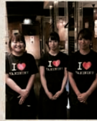
醍醐横浜店スタッフ

安心安全宣言！宴会は横浜醍醐におまかせ下さい！！ みんなでワイワイ飲んで食べて楽しくおしゃべりして 飲み放題つきで銘柄牛使用のコースを5,800円から ご用意しておりますので宴会は是非醍醐でどうぞ！ いずれのコースも2名様より承ります。 醍醐横浜店 店主